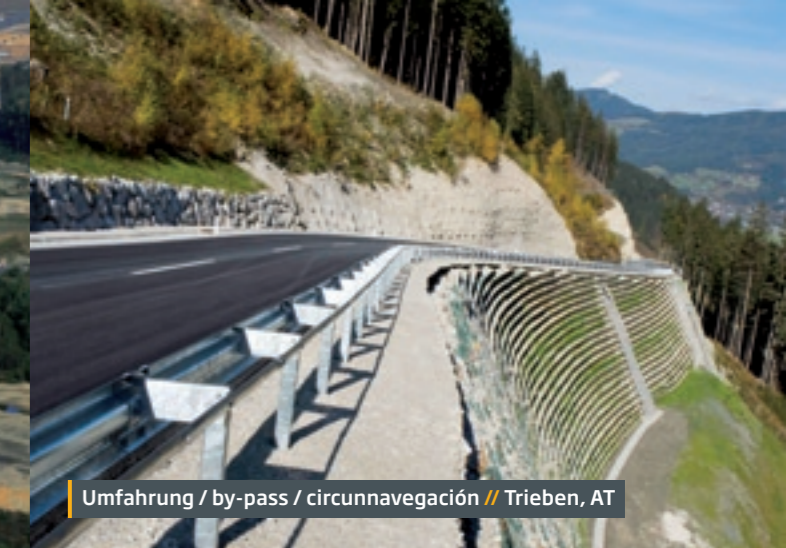
Umfahrung / by-pass / circunnavegación // Trieben, AT