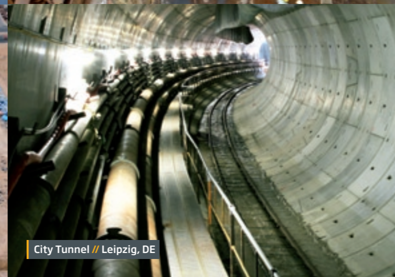
City Tunnel // Leipzig, DE