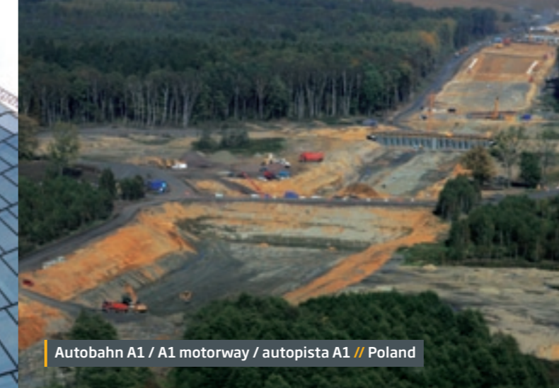
Autobahn A1 / A1 motorway / autopista A1 // Poland