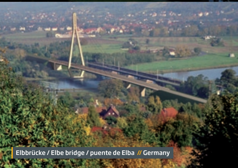
Elbbrücke / Elbe bridge / puente de Elba // Germany