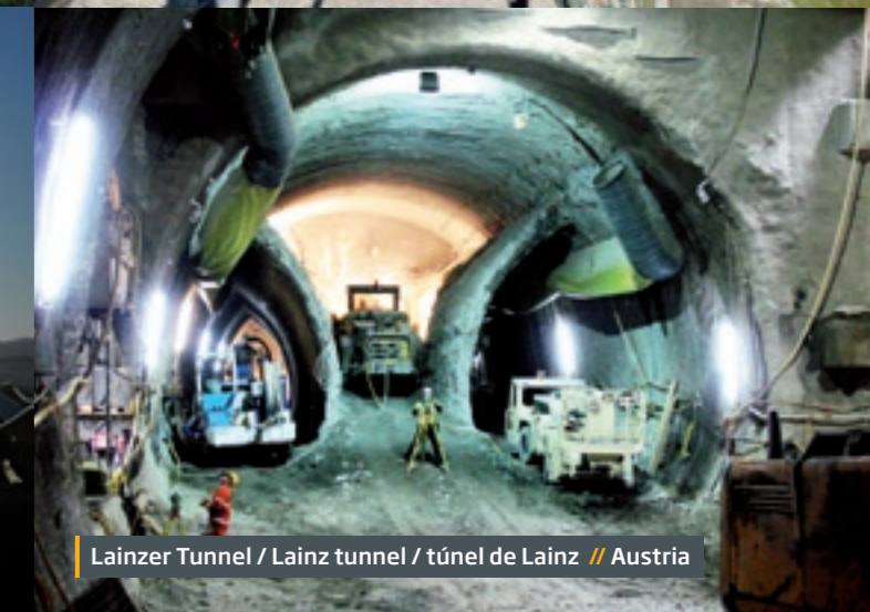
Lainzer Tunnel / Lainz tunnel / túnel de Lainz // Austria