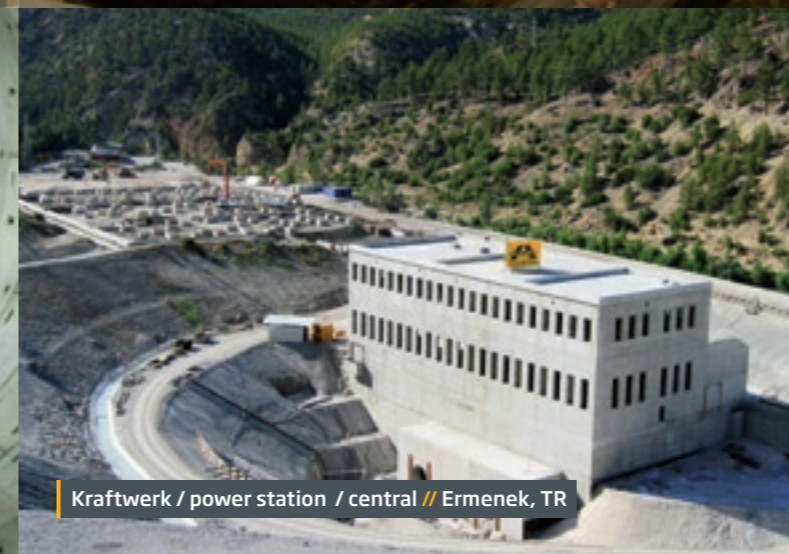
Kraftwerk / power station / central // Ermenek, TR