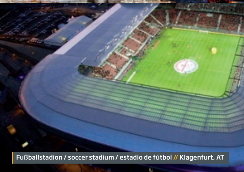
Fußballstadion / soccer stadium / estadio de fútbol // Klagenfurt, AT