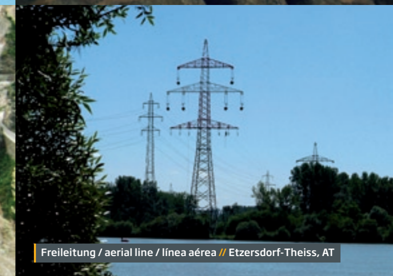
Freileitung / aerial line / línea aérea // Etzersdorf-Theiss, AT