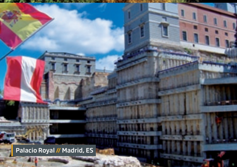
Palacio Royal // Madrid, ES