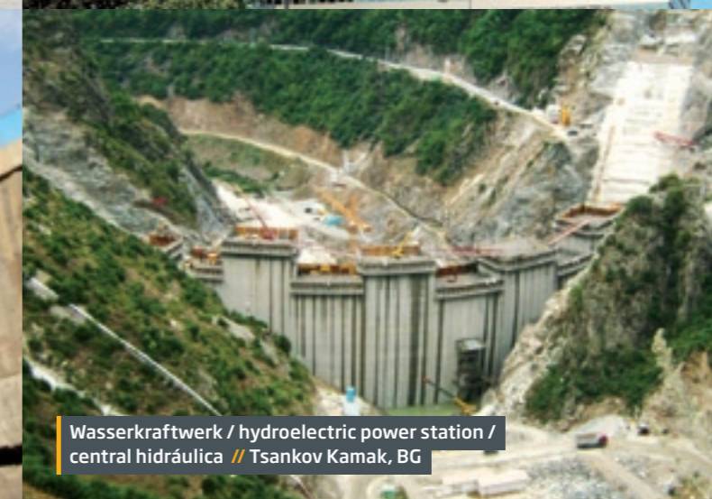
Wasserkraftwerk / hydroelectric power station / central hidráulica // Tsankov Kamak, BG