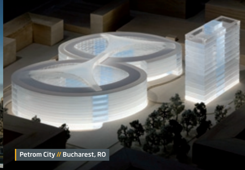
Petrom City // Bucharest, RO