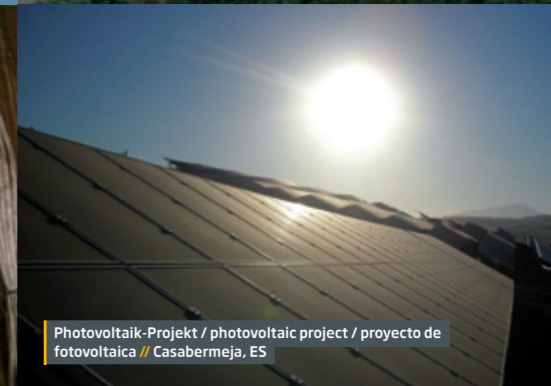
Photovoltaik-Projekt / photovoltaic project / proyecto de fotovoltaica // Casabermeja, ES