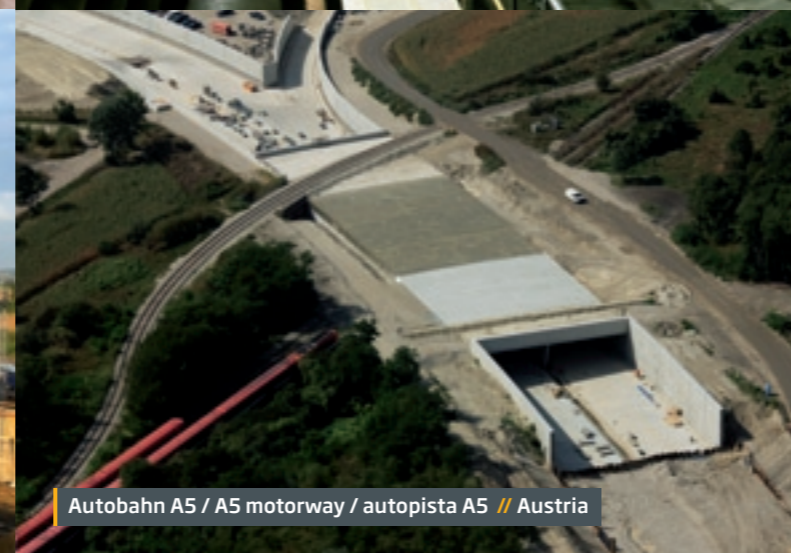
Autobahn A5 / A5 motorway / autopista A5 // Austria