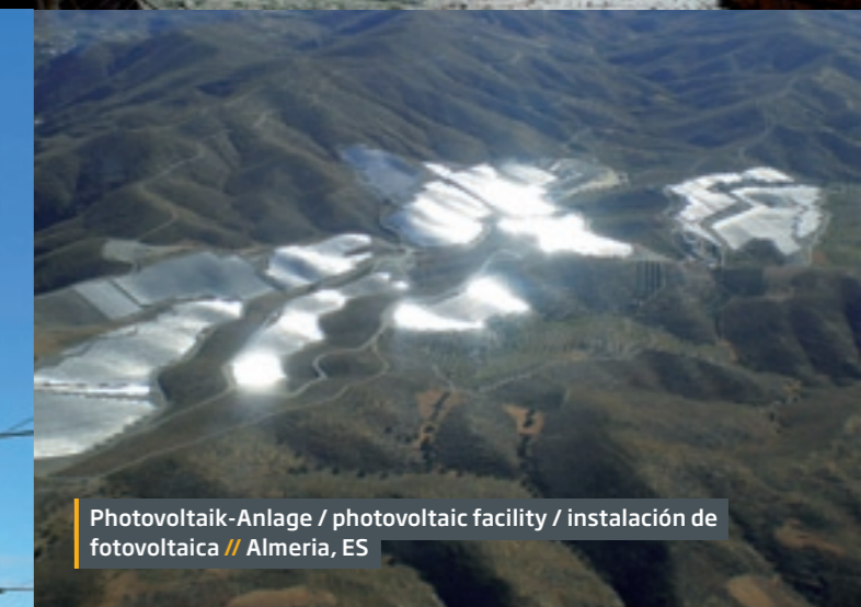
Photovoltaik-Anlage / photovoltaic facility / instalación de fotovoltaica // Almeria, ES