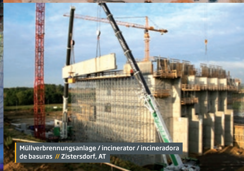
Müllverbrennungsanlage / incinerator / incineradora de basuras // Zistersdorf, AT