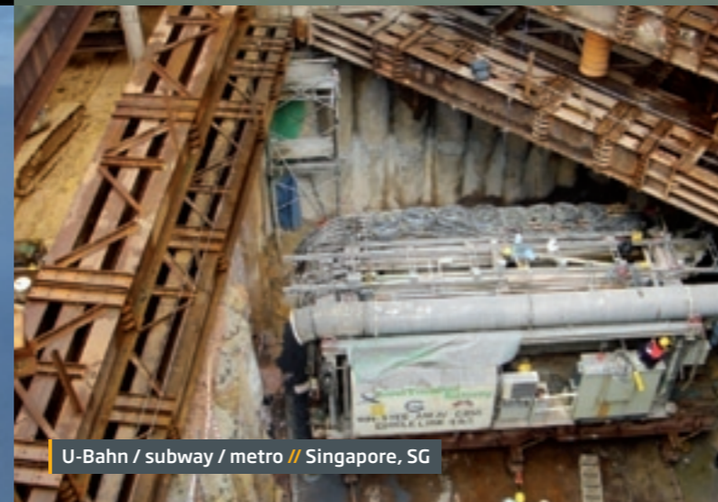
U-Bahn / subway / metro // Singapore, SG