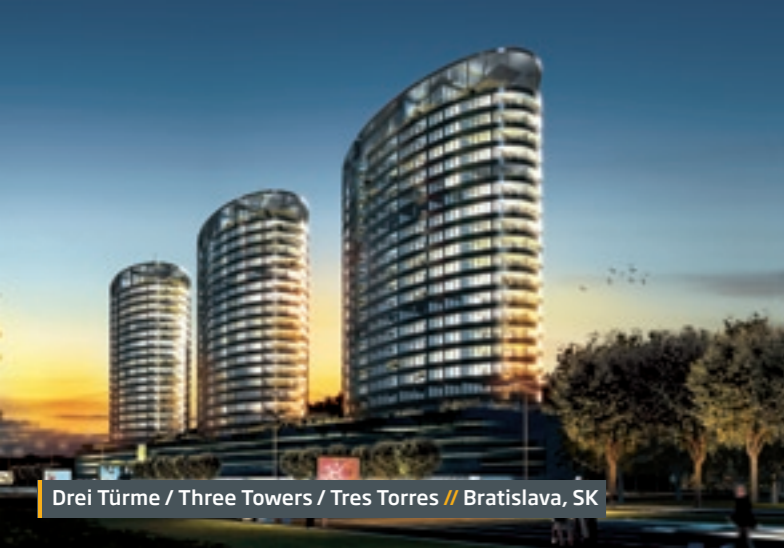
Drei Türme / Three Towers / Tres Torres // Bratislava, SK