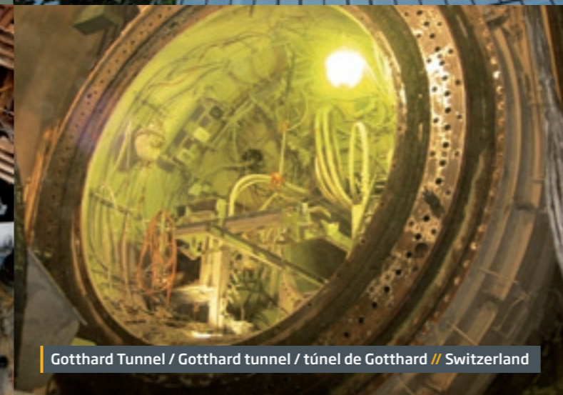
Gotthard Tunnel / Gotthard tunnel / túnel de Gotthard // Switzerland