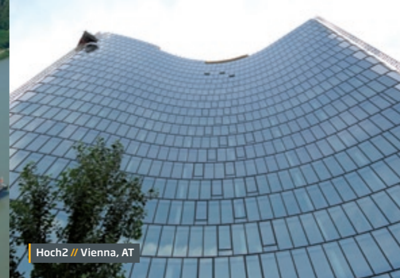
Hoch2 // Vienna, AT