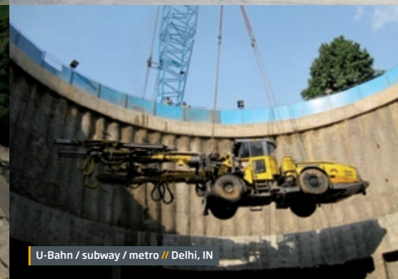
U-Bahn / subway / metro // Delhi, IN