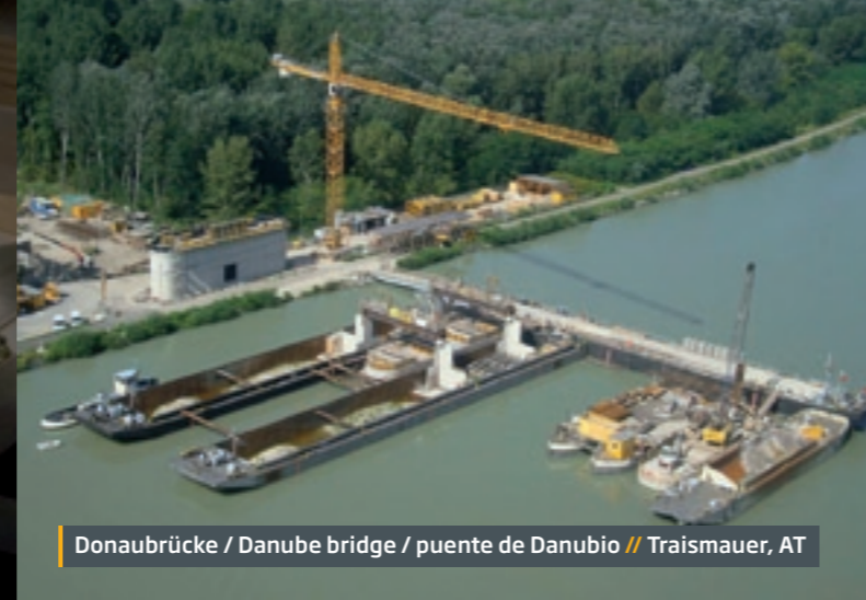
Donaubücke / Danube bridge / puente de Danubio // Traismauer, AT