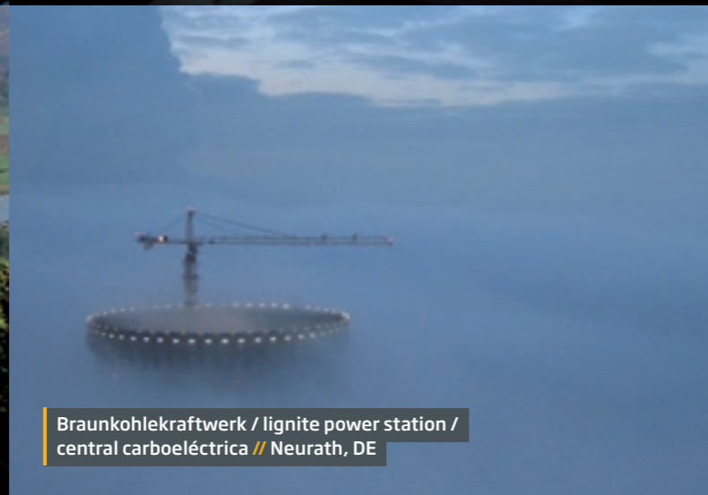
Braunkohlekraftwerk / lignite power station / central carboeléctrica // Neurath, DE